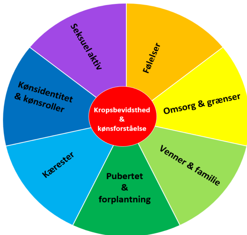
Figur 2: Model for undervisningsdifferentiering til elever med funktionsnedsættelse

Modellen (figur 2) illustrerer, hvordan en differentieret seksualundervisning kan tilrettelægges med udgangspunkt i elevernes forskellige forudsætninger, modenhed og interesser. 5